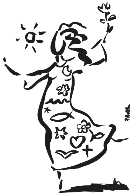
Grafik: Pfeffer aus Gemeindebrief

Eine wichtige Voraussetzung zum Glückseligkeit ist sicher eine grundsätzlich bejahende Einstellung zum Leben mit seinen Licht- und Schattenseiten. Denn manchmal ist es ja so: Was an der Oberfläche zunächst wie Unglück oder Pech aussieht, kann sich oft auch als Glück, als etwas Positives herausstellen. Und auch das Umgekehrte ist möglich, dass nämlich das, was an der Oberfläche gut erscheint, in Wirklichkeit gar nicht gut ist. Ein katholischer Theologe meint: „Wir sind dann weise, wenn wir Gott die Entscheidung überlassen, was Glück und Unglück