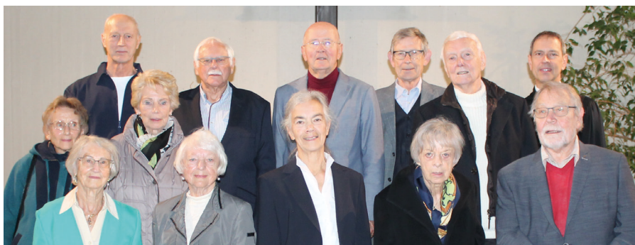
Letztes Jahr: Am 26. Oktober in der Johanneskirche.