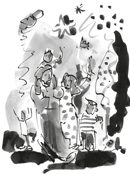
Grafik: Pfeffer aus Gemeindebrief

Und jetzt soll es nach den Glücksblockaden noch ein paar Glückstipps geben. Vielleicht können wir uns ja einen Trampelpfad zum Glück bauen. Eckart von Hirschhausen sagt in seinem Buch „Glück kommt selten allein“ allerdings: „Mit Glückstipps ist es ähnlich wie mit Diätatrabern: