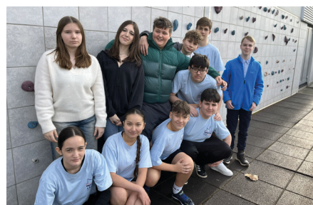
Dabei sein ist alles: Das Team der Johannesgemeinde beim KonfiCup am 17. Januar.